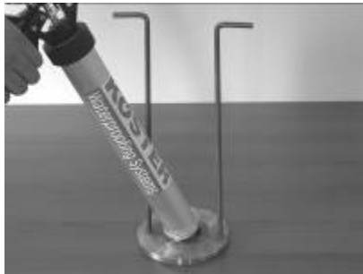
1. Sosis tabancasının ucunu sökerek adaptöre monte ediniz.