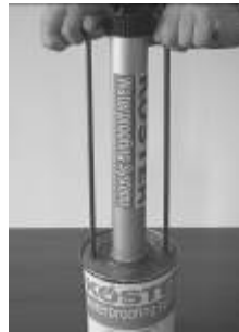
2. Hazırlanan karışımı adaptör yardımı ile doldurunuz.