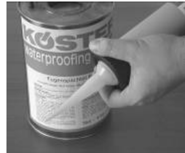
3. Sosis tabancasının ucunu monte ediniz.